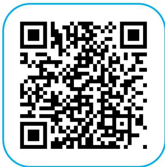
プラスシード 中学校アカウント新規登録

他校でアカウントを登録済みの場合は、ログイン後に出願校切り替えをおこなってください。