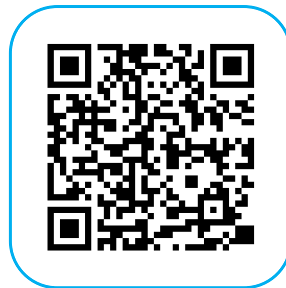
プラスシード 中学校アカウントログインページ