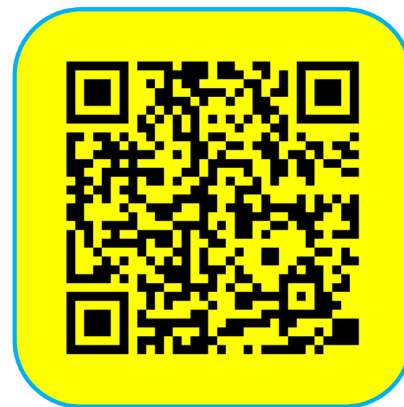
プラスシード 中学校アカウントログインページ